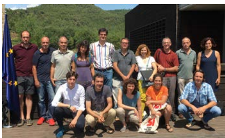
Representants dels socis del projecte, després de la reunió.

El passat divendres va tenir lloc a la seu del Centre Tecnològic Forestal de Catalunya (CTFC), a Solsona, la reunió d'inici del projecte Life Alnus, centrat en millorar la conservació de les vernedes mediterrànies. L'objectiu és invertir la regressió i la degradació d'aquesta hàbitat de ribera a Catalunya, per mitjà d'accions que es puguin transferir a la resta de les conques catalanes i també a escala mediterrània.